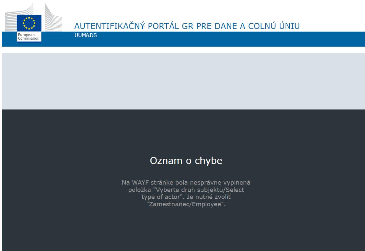
Obrázok 2 - Oznámenie o chybe pri nesprávnom vyplnení niektorej z položiek na prihlasovacej WAYF stránke

V prípade, že ako prihlasujúci druh subjektu nebol zvolený „Zamestnanec/Employee“, tak po presmerovaní na prihlasovaciu stránku SK-IAM sa zobrazí oznámenie o nesprávnom vyplnení prihlasovacej WAYF stránky. Podobné oznámenie so znením konkrétnej chyby sa zobrazí aj v prípade nesprávneho vyplnenia niektorých ďalších položiek.